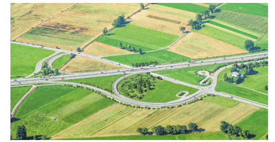
Bauarbeiten für Anschluss Rheintal-Mitte sollen 2019 starten. Unten: Bregenzer Kirchstraße.