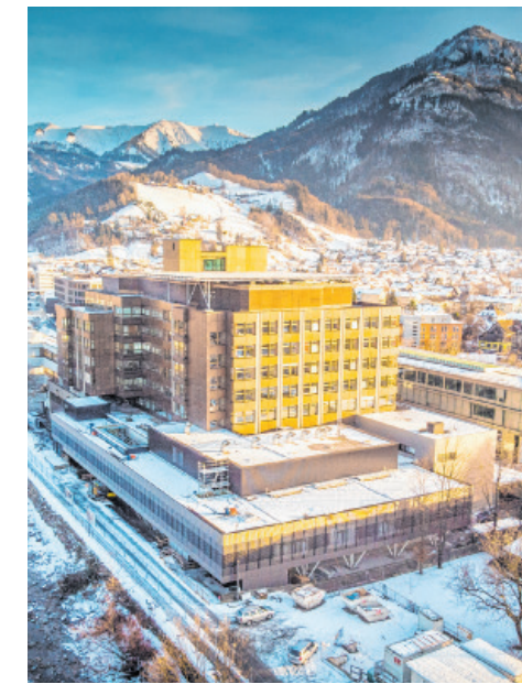
Quartier am Jahnplatz Feldkirch (I.), neuer OP-Trakt am KH Dornbirn. HARTINGER